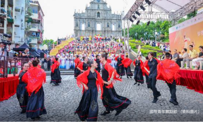
國際青年舞蹈節 (資料圖片)

熱氣氛。音樂方面同樣精彩， 澳門威尼斯人榮譽呈獻: 楊丞琳《房間裡的大象》世界巡迴演唱會 - 澳門站 (7月4日)、 2026 NCT JNJM FANMEETING TOUR [DUALITY] # MACAU (7月11日及12日) 帶動音樂熱潮，還有更多演唱會及音樂表演等您欣賞。靜心欣賞的表演節目、忘情吶喊的體育賽事、沉浸式投入偶像的歌聲當中……七月暑日來澳，以多元方式消暑！